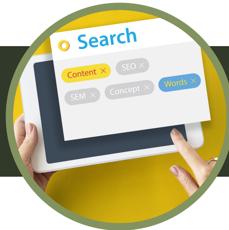
Integración de la entrevista a la web y en You Tube, repost colaborativos