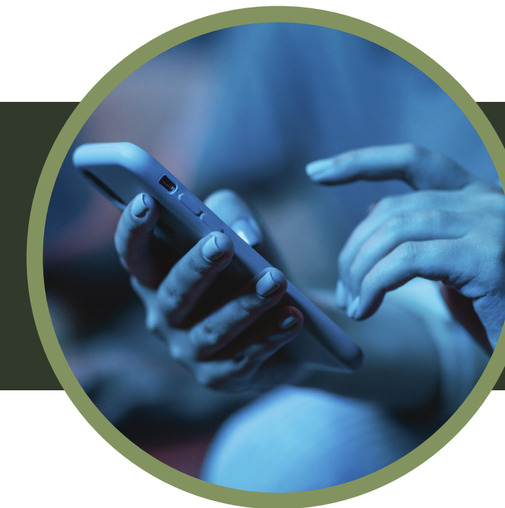
Difusión en redes sociales de 2 clips de entrevista en formato reel de hasta 40s