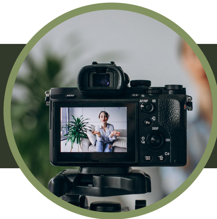
Entrevista grabada (Segmento Voces)