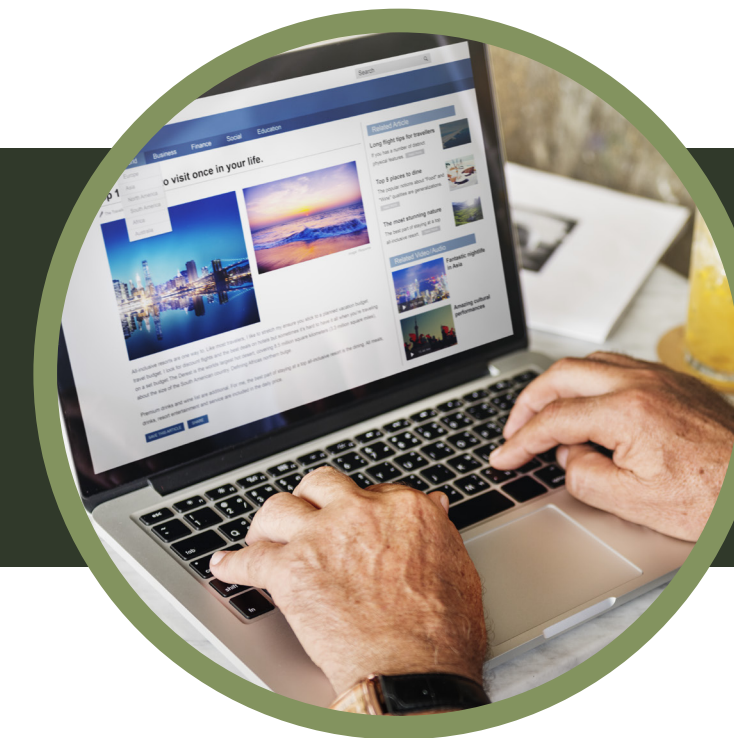
Banners de apoyo en web y banner principal sobre una publicidad o campaña de marca