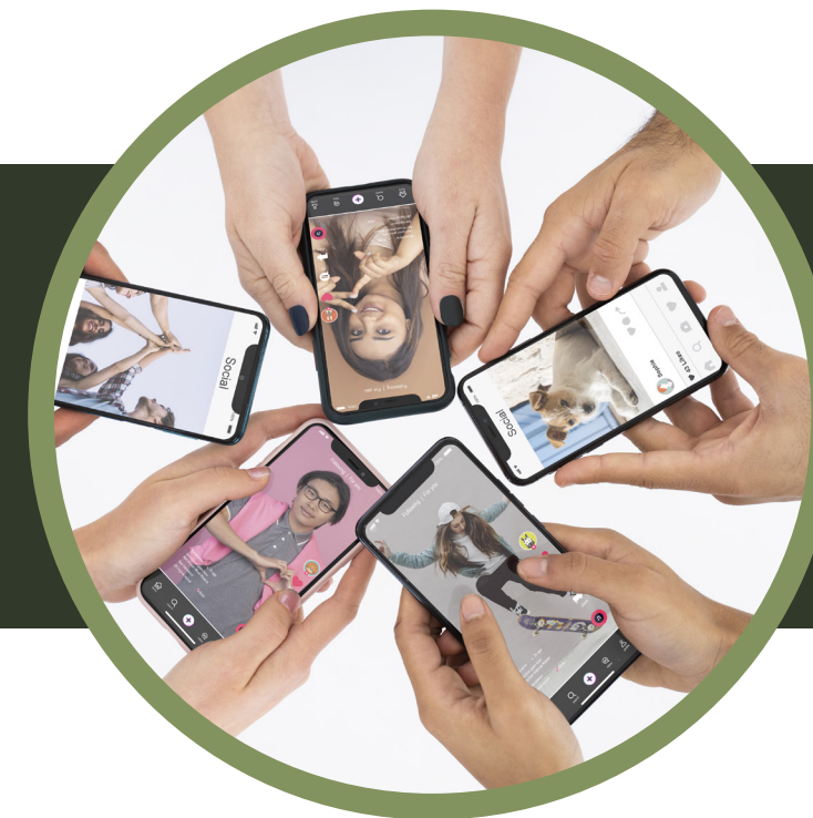
Difusión en redes sociales (4 posteos)