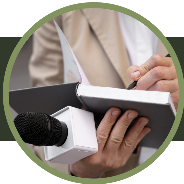
Publireportaje digital (Brand Voice)

Comunicación 360 para potenciar tu marca personal o empresarial con propósito