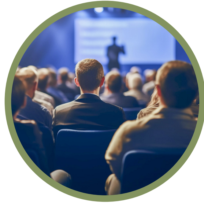
Cobertura de eventos